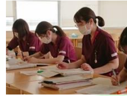
看護師になって1年が経とうとしています。みなさんの顔つきもすっかりお姉さん。頑張ってきた1年を振り返ります。