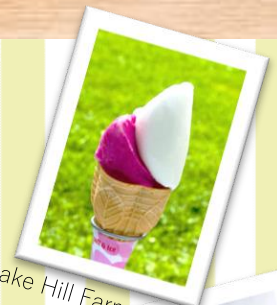
Lake Hill Farm