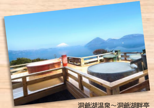
洞爺湖温泉～洞爺湖畔亭