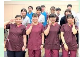
1年間、辛いこと苦しいこともあったけど、毎日、頑張っって成長した私。4月から先輩看護師になります。