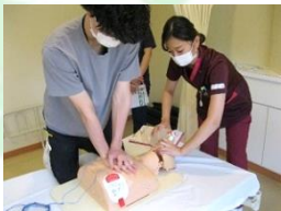
人工呼吸器の研修 BLS・AED 研修