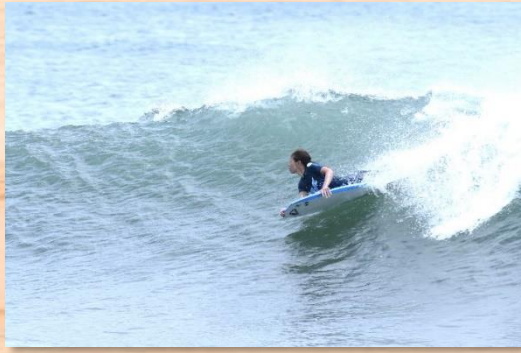
内浦湾でボディボード