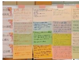
複数の患者さんを受け持ち、学生の時は違い優先順位を考えながらケアを行います。