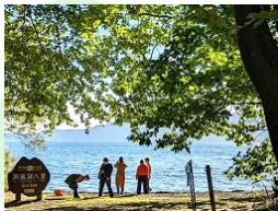
日々の緊張から離れリフレッシュ。新人同士の交流を図りましょう。