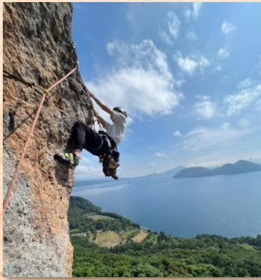
洞爺湖をバックにクライミング